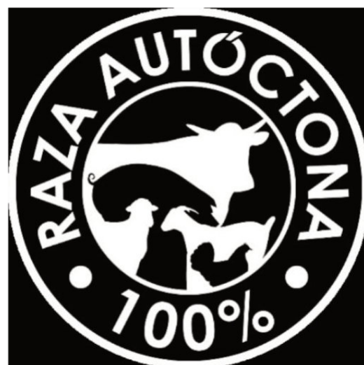
Sello raza autóctona 100%. Ministerio de Agricultura, Pesca y Alimentación.