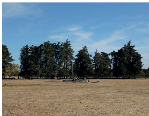
Figura 3 Cortina de abrigo ( Cupressus spp) para redução do efeito do vento na parcela agrícola