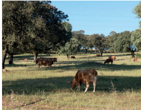
Figura 1 Sistema silvopastoril de montado de azinho ( Quercus ilex L.) pastoreado com gado bovino