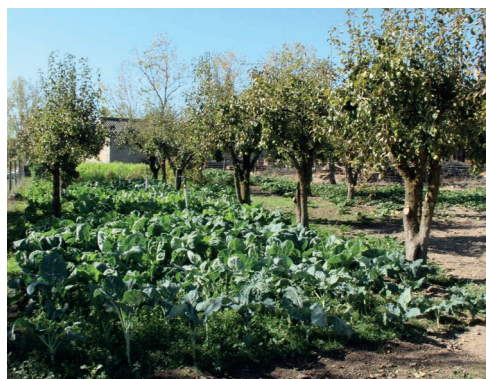
Figura 4 Horta familiar onde a produção por árvores de fruta é combinada com produção hortícola variada

RAINs, estando aqui incluídas: práticas e experiências inovadoras, resultados de projetos regionais, nacionais e internacionais, literatura científica e literatura cinzenta.